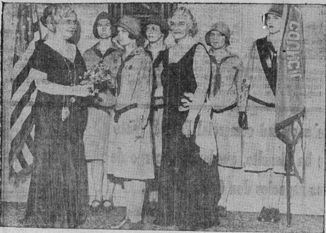
La señora Herbert Hoover, esposa del presidente de los Estados Unidos, recibiendo un bouquet de flores de manos de una de las girl-scouts de Nueva York. La señora Hoover fue de Washington a Nueva York, sólo para asistir al banquete de las girl-scouts.