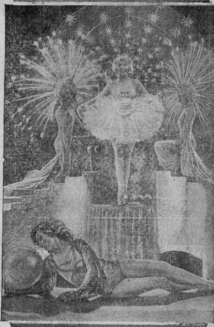
Scene from Florenz Ziegfeld's "Glorifying the American Girl" A Paramount Picture with Mary Eaton

Nuestros lectores saben que se viene organizando una espléndida función a beneficio de la Asociación de Estudiantes de Derecho con el objeto de financiar el viaje del representante de dicha asociación a México y el comité con buen criterio ha logrado que esa función se lleve a cabo esta noche en el Raventós combinando un interesante programa en el cual tomarán parte distinguidos jóvenes de nuestra sociedad con la proyección de una extraordinaria película.